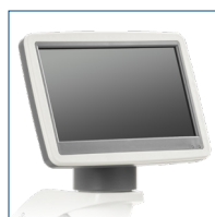
Cabezal con pantalla LCD