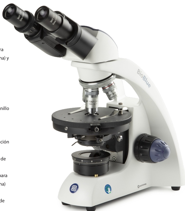
● Modelo de polarización BB.4260-P-HLED

APL (Anti-bacterial Protection Layer) es un tratamiento de pintura revolucionario que se aplica a las partes más críticas de nuestros productos. Un microscopio con APL restringirá el crecimiento de microorganismos, incluidas bacterias y moho