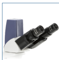
Cabezal digital binocular