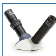
Cabezal de discusión